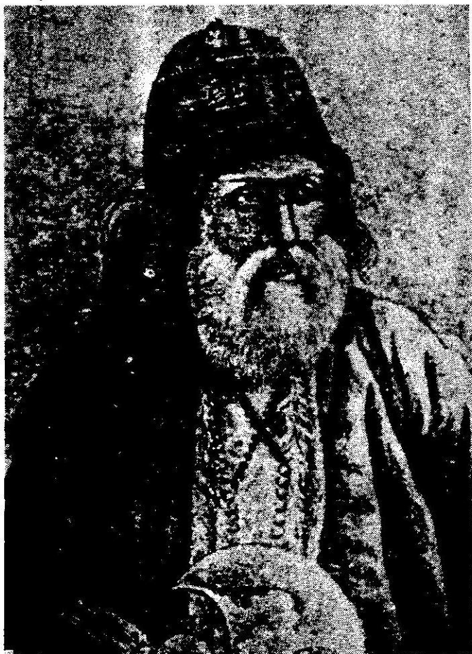
تصویری از میرزا حسینعلی بهاء